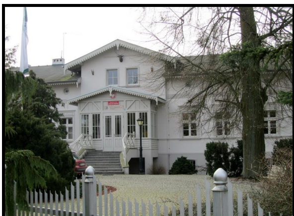
Ośrodek Edukacji Leśnej (dworek) w Czeszewie