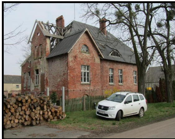
Cenne zabudowania w Czeszewie - Budy