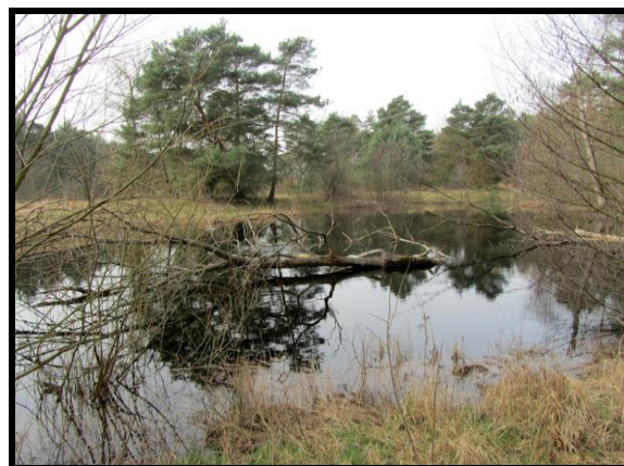
Rzeka Warta oraz starorzecze Warty