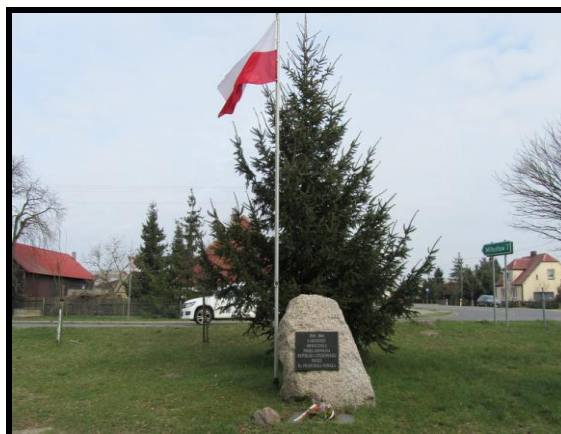
Obelisk upamiętniający 100 rocznicę proklamacji Republiki Czeszewskiej