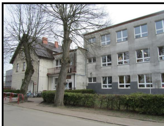
Szkoła Podstawowa im. Jana B. Sokołowskiego