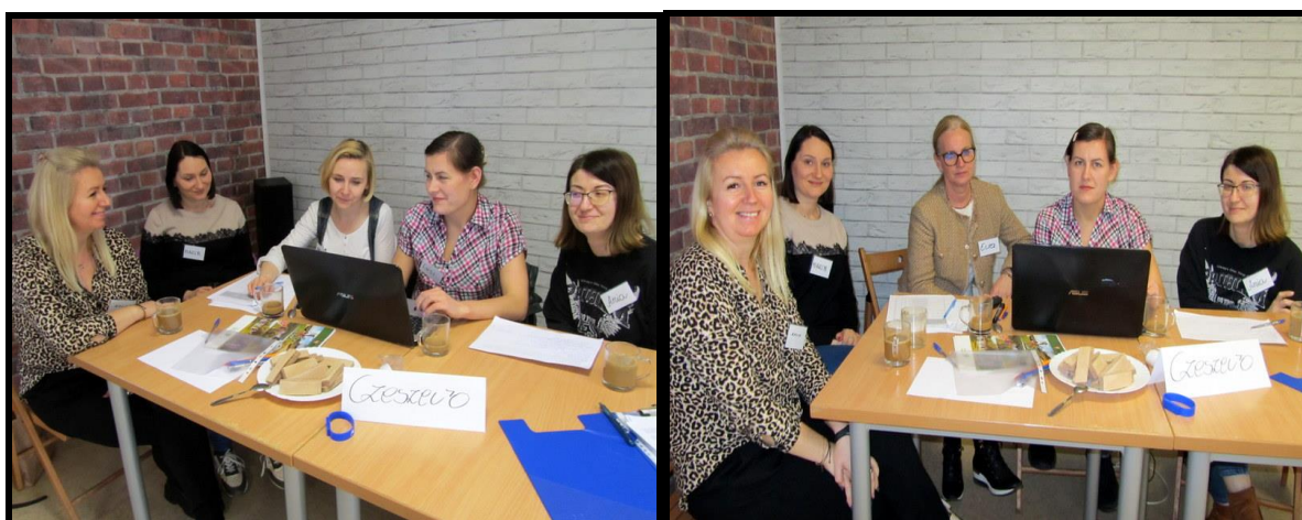
Grupa Odnowy Wsi w czasie warsztatów opracowania Sołeckiej Strategii Rozwoju Świetlica wiejska w Lipiu w dniach 15-16.III.2024 r.

SOLECKA STRATEGIA ROZWOJU – CZESZEWO wypracowana przez GOW na warsztatach w ramach programu UMWW - „Wielkopolska Odnowa Wsi 2020+”