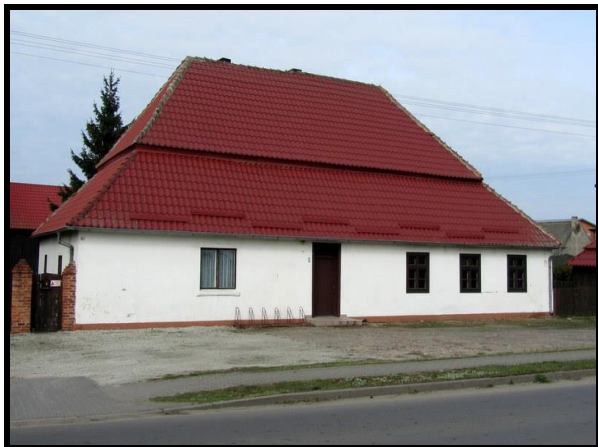
Zabytkowa karczma szachulcowa (otynkowana) z końca XVIII w.