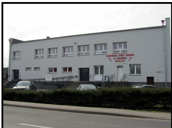
OSP oraz Świetlica wiejska