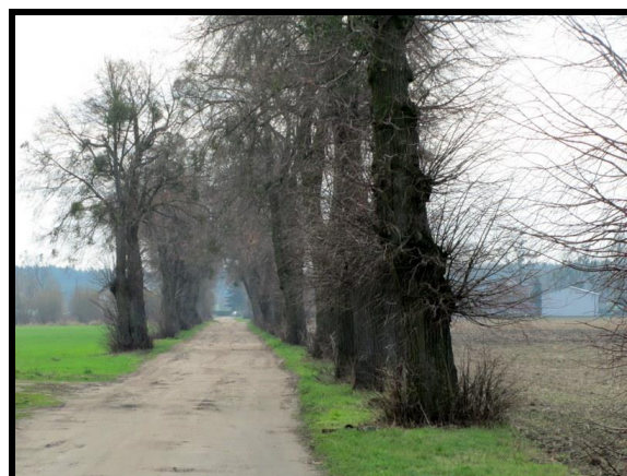
Walory przyrodnicze Czeszewa przy ul. Lipowej