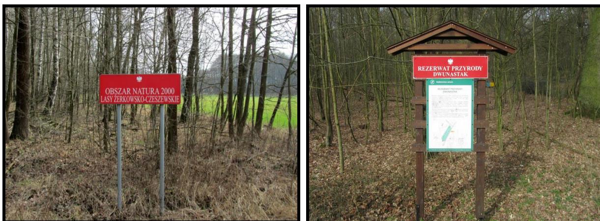
Walory przyrodnicze sołectwa Obszar NATURA 2000 oraz Rezerwat Przyrody Dwunastak

SOLECKA STRATEGIA ROZWOJU – CZESZEWO wypracowana przez GOW na warsztatach w ramach programu UMWW - „Wielkopolska Odnowa Wsi 2020+”