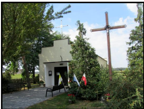
Kaplica pw. Matki Bożej Częstochowskiej