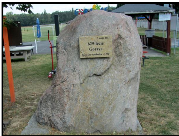
Gorzycy wieś o bogatej historii