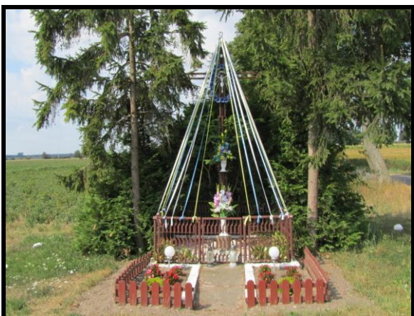
Miejsce kultu religijnego