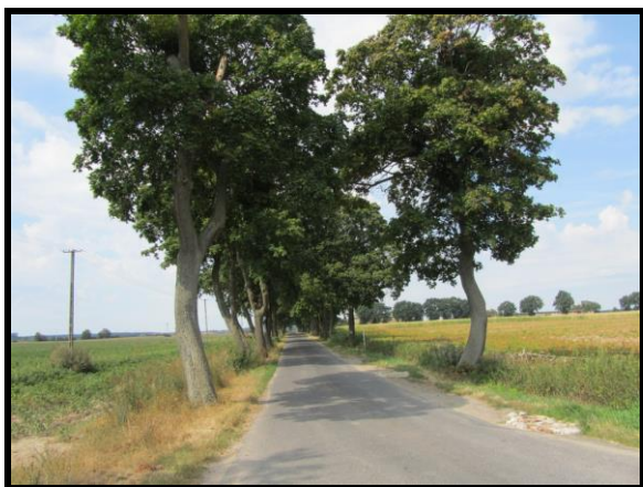
Walory przyrodnicze Chrustowa