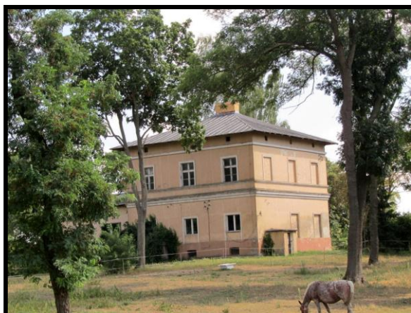
Prywatny pałac z II połowy XIX w.