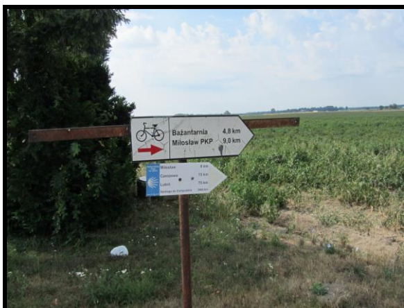
Oznakowane szlaki turystyczne