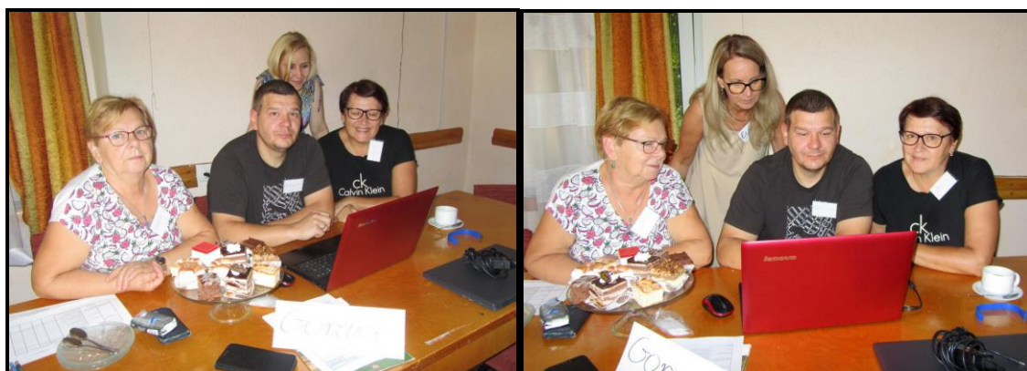
Grupa Odnowy Wsi w czasie warsztatów opracowania Sołeckiej Strategii Rozwoju Świetlica wiejska w Gorzycach w dniach 23-24.VIII.2024 r.

SOLECKA STRATEGIA ROZWOJU – GORZYCE wypracowana przez GOW na warsztatach w ramach programu UMW – „Wielkopolska Odnowa Wsi 2020+”