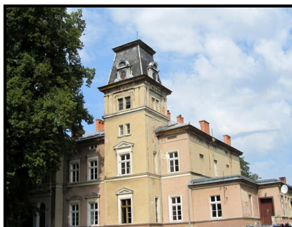
Neorenesansowy pałac z ok. 1890 r. Międzynarodowy Dom Spotkań Młodzieży