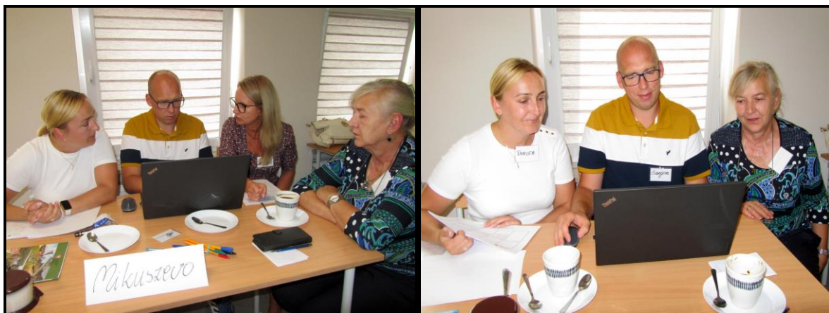
Grupa Odnowy Wsi w czasie warsztatów opracowania Sołeckiej Strategii Rozwoju Świetlica wiejska w Orzechowie w dniach 23-24.VIII.2024 r.

SOŁECKA STRATEGIA ROZWOJU – MIKUSZEWO wypracowana przez GOW na warsztatach w ramach programu UMWW - „Wielkopolska Odnowa Wsi 2020+”