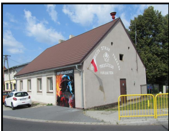
OSP oraz Świątlica wiejska