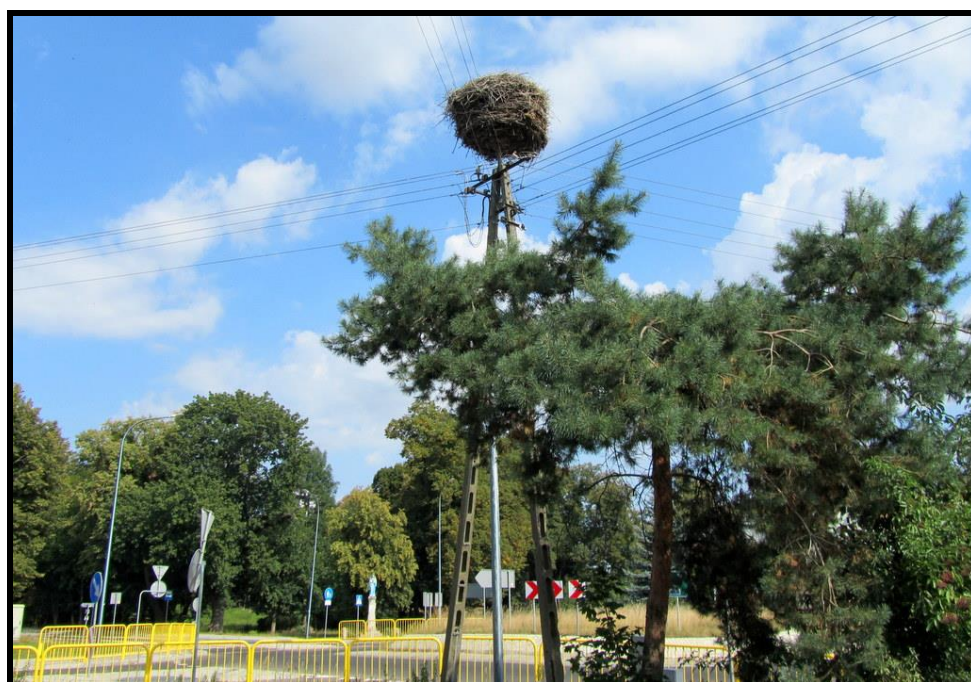
Gniazdo bociana białego w centrum Mikuszewa